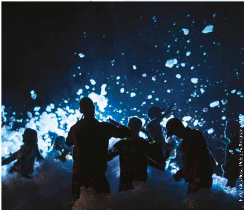
Poletje v Ankaranu 2017

V njihov vroč mix se bo za dvig nočnih temperatur zamešalo še izzive družabnih iger, dobro družbo in spektakularne goste. Da se poletje konča vroče! In v peni!