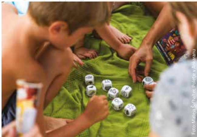
Poretje v Ankaranu