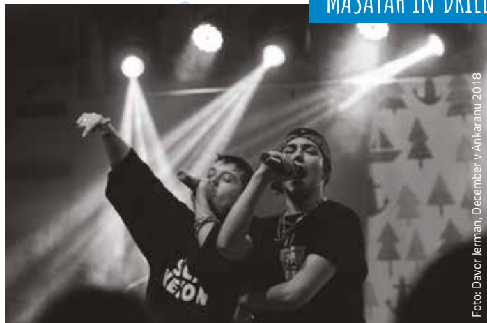
December v Ankaranu 2018