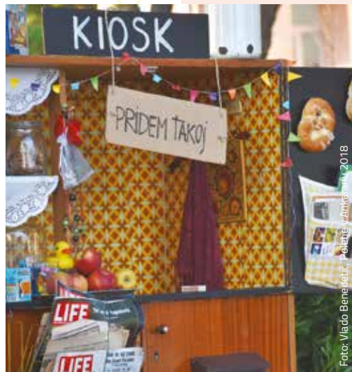
Polare v Ankeni, 2018

Omارة stare šare so majhni svetovi, ki v javnem prostoru čakajo svojega raziskovalca. Za škripajočimi vrati se skrivajo intimne atmosfere otroških spominov, lokalnih zgodb, mitoloških bitij in prostorske poezije, ki razburkajo domišljijo, angažirajo vse vaše čute in vas dobesedno potegnejo vase ... Kolektiv Tretja roka – počne tisto, kar bi lahko počeli vsi, če ne bi imeli samo dveh rok, pri tem pa uporablja stvari iz druge roke, jih preoblikuje, sestavlja, posreduje naprej ali nazaj, čisto vseeno, samo da na koncu pridejo v prave roke.